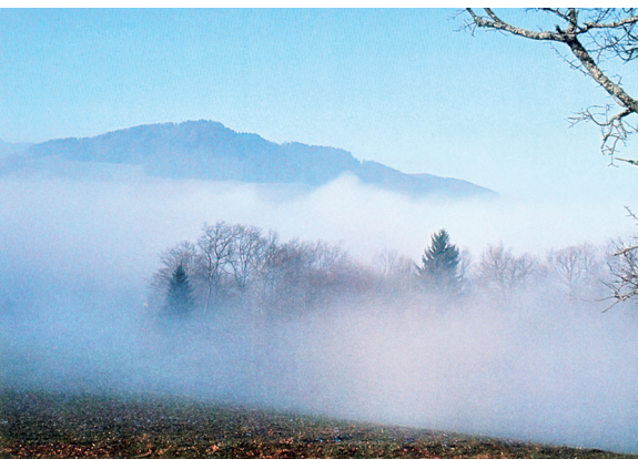
Freundlich und leicht mystisch liegt die Freiburger Winterlandschaft vor einem.

Transports publics fribourgeois tpf Tel. 026 351 02 40, www.tpf.ch